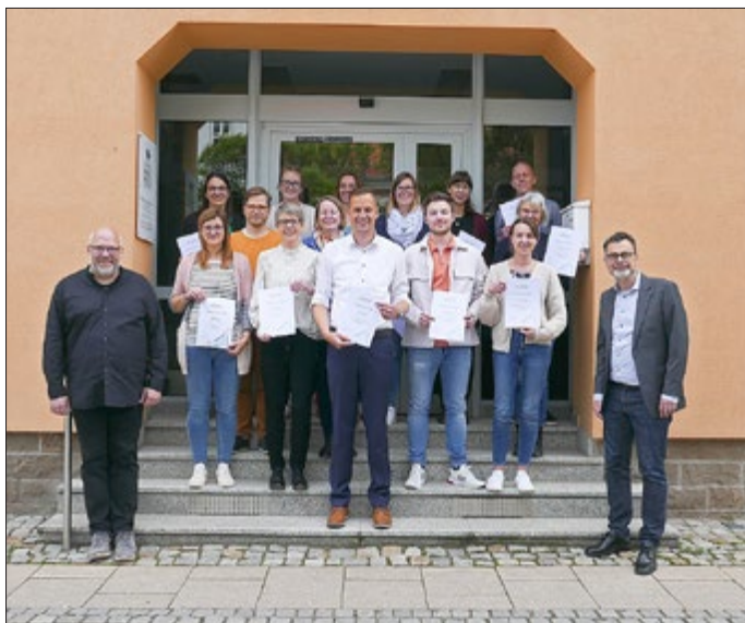
Teilnehmer:innen der KomfortDenker-Werkstatt

Hinweis: Für den Inhalt in diesem Blatt eventuell abgedruckter Wahlwerbung und/oder Anzeigen mit politischem Inhalt ist ausschließlich die jeweilige Partei/politische Gruppierung verantwortlich.