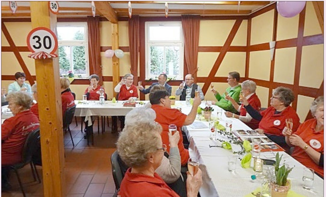
Anstoßen auf die Vergangenheit und auf die Zukunft