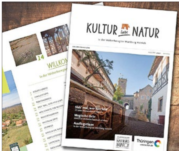
Erlebnismagazin der Welterbergregion Wartburg Hainich e.V.

Die gedruckte Ausgabe besteht aus Naturpapier, das besonders schonend und nachhaltig hergestellt wurde. Das Magazin wird kostenfrei abgegeben und ist zum einen telefonisch oder per E-Mail über die Geschäftsstelle des Welterbergregion Wartburg Hainich e.V. erhältlich. Das „Infomobil“ der Region beliefert zum anderen auf neun Touren über 370 Institutionen, wie Ausflugsziele, Touristinformationen und touristische Knotenpunkte in Thüringen und angrenzenden Bundesländern. Das Magazin liegt in der Welterbergregion und weiteren Regionen bei touristischen Einrichtungen wie Beherbergungsbetrieben und Gastronomen sowie Stadtverwaltungen aus.