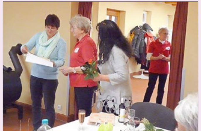
Der hohe Besuch aus Erfurt im Gespräch mit einzelnen Landfrauen

Text: Monika Seeling, Evelyn Karnofka Gedicht: Margrit Facklam