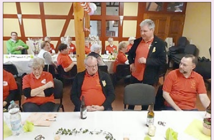
Gäste von anderen Vereinen des Ortes gratulieren zum Jubiläum